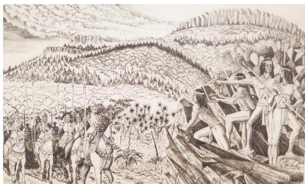
Imagen 2.- Fundación De Zacatecas.

Avenido el nunca vencido Joanes de Tolosa año de 1546 día de la natividad de Nuestra Señora [...] docilitando el ánimo de los Bárbaros infieles [...] y por medio de un intérprete del idioma Zacateco les dio a entender lo errados que habían vivido hasta entonces, a su vez noticiaron los naturales a Tolosa lo rico y abundante de sus minerales de Plata 6