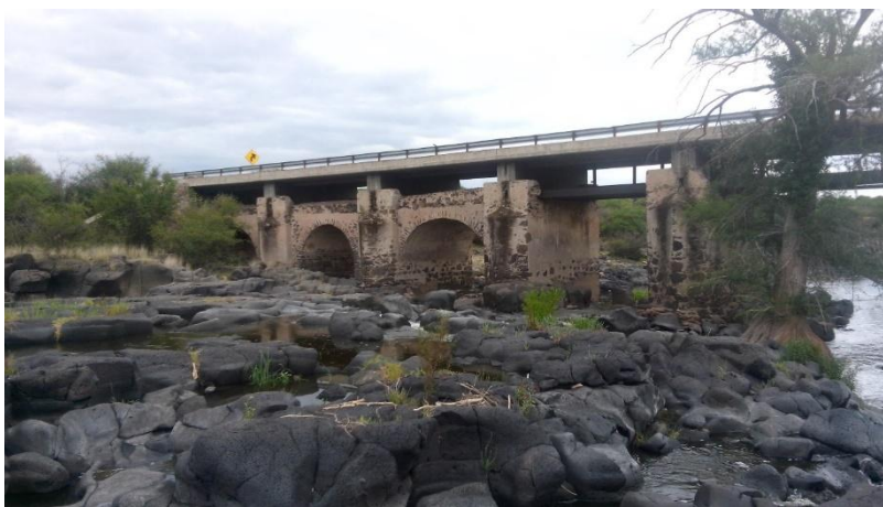
Fotografía 2.- El Saltillo, en la Carretera Los Berros – Durango.

En algunos puntos de la carretera moderna se pueden apreciar elementos antiguos sepultados bajo el asfalto y el concreto.