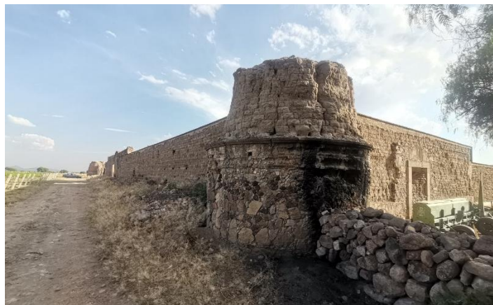
Fotografía 3.- Fuerte y hacienda de San Diego en Luis Moya Zacatecas.

Se aprecia uno de los torreones del fuerte aún en pie.