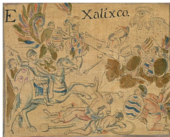
Imagen 1.- Lienzo de Tlaxcala, Lámina 53, Xalixco.