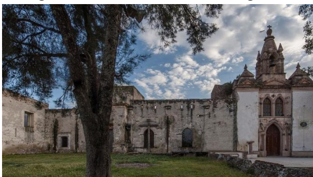
Fotografía 4.- Hacienda de Montenegro, Qro.

En cuanto a la representatividad de la declaratoria en relación con el universo de sitios de valor patrimonial encontramos que de los 60 sitios contenidos en la declaratoria 15 son templos y capillas, 10 son villas y ciudades, 9 son Reales de Minas, 8 haciendas, 7 puentes, 4 tramos del camino, 3 conventos, 2 fuertes militares, 2 cuevas con pinturas rupestres, un paisaje natural y un cementerio (2 sitios aparecen con 2 categorías). Y para poder evaluar su representatividad, en el transcurso de la presente investigación se identificaron más de 200 sitios, pero se sabe existen más, de los cuales 60 son villas o ciudades, 50 son haciendas, 35 Reales de Minas, 15 Puentes, 10 Fuertes y Presidios, 10 Conventos y colegios, 10 unidades de paisaje 40 , 6 tramos del camino antiguo y 5 ventas y mesones. Si se toma como criterio una selección de 1/3 de los sitios, tendríamos que la declaratoria actual no es del todo representativa. Respecto a las capillas y los templos, todas las villas, los reales de minas y las haciendas tenían templos y capillas por lo cual es redundante incluir sitios contenidos en otros más generales. La gestión del patrimonio cultural requiere de un estudio más detallado y con un enfoque más inclusivo que considere la diversidad y complejidad de los sitios históricos, garantizando así su preservación y valoración adecuadas para las generaciones futuras.