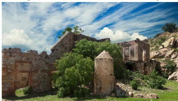
Fotografía 5.- Real de minas de Comanja